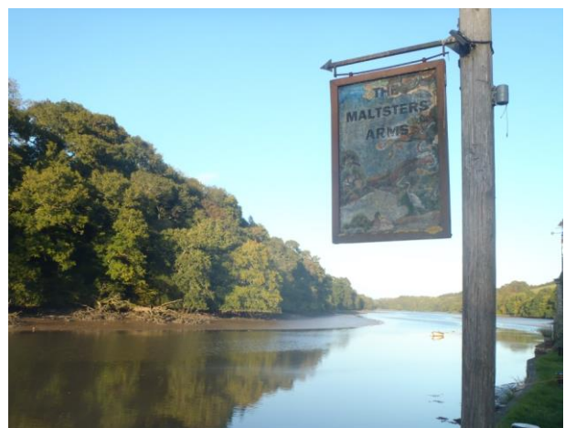
Bow Creek – The Maltsters Arms