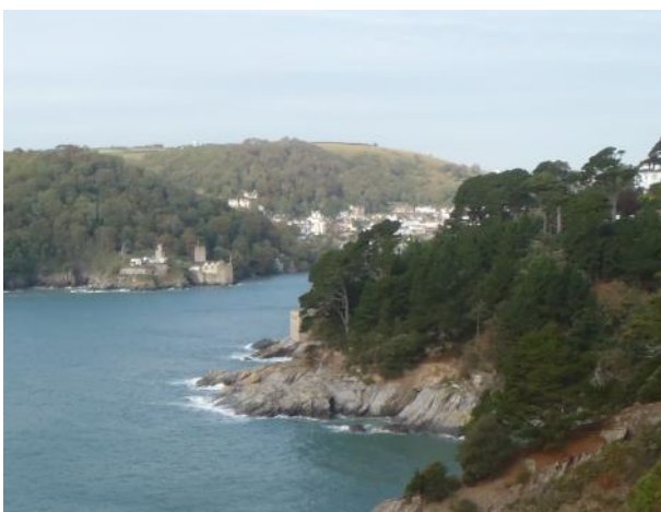
Küste bei Dartmouth

Unsere zweite Wanderung in England führt Sie in 4 – 6 Tageswanderungen von Exeter entlang dem River Teign , über das Dartmoor bis zur Gezeitenlandschaft des Dart Creek , nach Dartmouth zur Küste und dem South-West-Coast-Path .