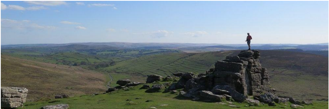
Blick über das Dartmoor

Für März/April 2020 suchen wir zwei Gruppen als Pioniere, die die Wanderung und die Unterkünfte testen. Informationen zu den Anforderungen an Pioniere